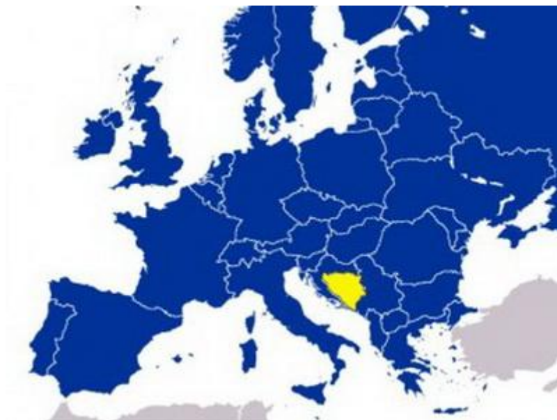
Položaj BiH u regiji

Općina Prozor – Rama smještena je u središnjem dijelu Bosne i Hercegovine, u Hercegovačko-neretvanskoj županiji/kantonu. Površina općine iznosi 477 km 2 .