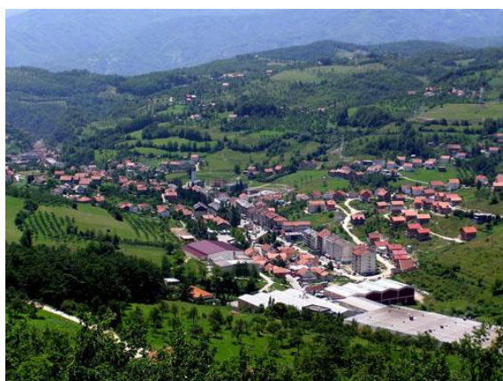
Prozor – Rama