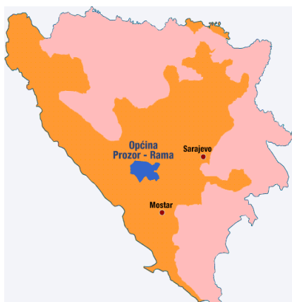
Prozor – Rama u BiH